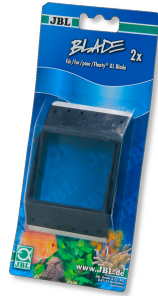
JBL BLADE para FLOATY L/XL