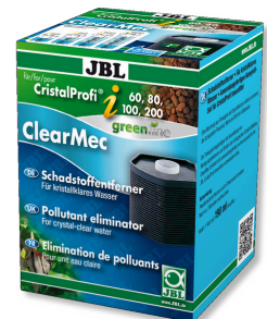
JBL Clearmec CristalProfi i60/80/100/200 Eliminador de nitrito, nitrato e fosfato para CPI