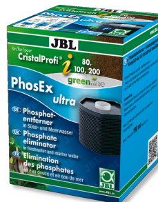
JBL PhosEx Ultra CristalProfi i60/80/100/200 Cartucho eliminação de fosfato para JBL CristalProfi i