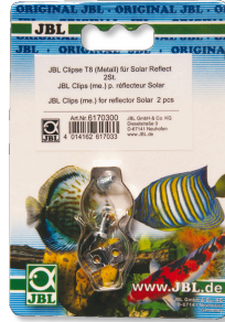
JBL Clipes T5/T8 metal Suporte de metal para lâmpadas fluorescentes