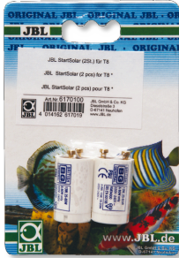
JBL StartSolar Ativador para tubos fluorescentes solares T8