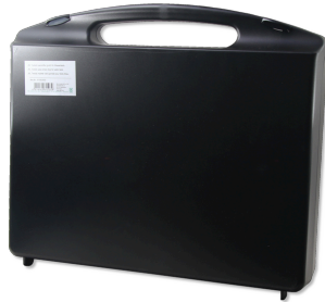
JBL Testlab vazio+ insertos