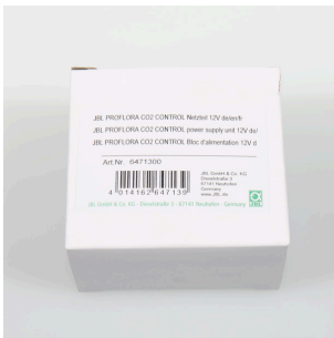
Fuente de alimentación 12V JBL PF CO2 CONTROL