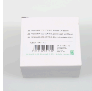
Fuente de alimentación 12V JBL PF CO2 CONTROL