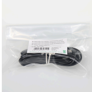
Sensor de temperatura JBL PF CO2 CONTROL