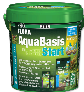
JBL PROFLORA AquaBasis Start

Sustrato nutritivo duradero p. acuarios de agua dulce