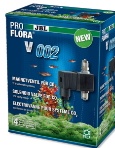
JBL PROFLORA v002 Válvula electromagnética silenciosa