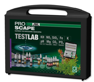
JBL PROAQUATEST LAB PROSCAPE Maletín de tests para analizar agua acuarios plantados