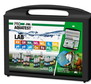
JBL PROAQUATEST LAB Maletín con 13 test para analizar el agua dulce