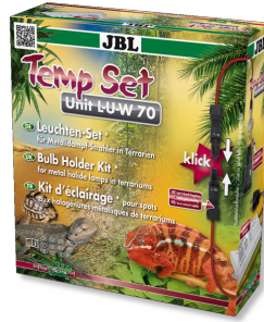
JBL TempSet Unit L-U-W Kit instalación lámparas de vapor metálico (LUW/HQI)