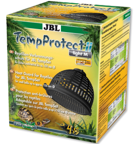
JBL TempProtect II light Protector contra quemaduras reptiles para JBL TempSet