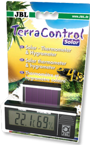
JBL TerraControl Solar Termómetro solar e higrómetro para todos los terrarios