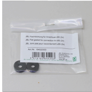
JBL ProFlora u95 junta plana