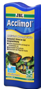
JBL Acclimol Acondicionador para la aclimatación de peces nuevos