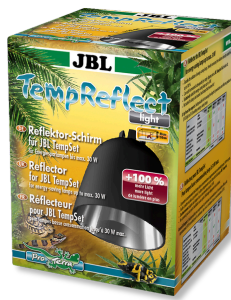
JBL TempReflect light Pantalla reflectora para lámparas de bajo consumo