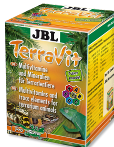
JBL TerraVit polvo Vitaminas y micronutrientes para animales de terrario