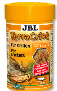
JBL TerraCrick Alimento completo para insectos vivos