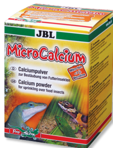
JBL MicroCalcium Pienso complementario rico en minerales para reptiles