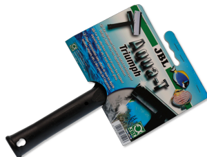
JBL Aqua-T Triumph Limpiacristales con cuchilla acero fino/rasqueta goma