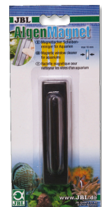
JBL Algae magnet Imán limpiacristales para cristales de acuario