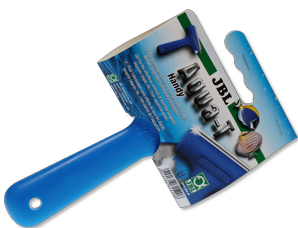
JBL Aqua-T Handy Limpiacristales con cuchilla de acero fino