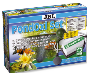
JBL PondOxi-Set Set de aireación con bomba de aire para el estanque