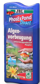
JBL PhosEx Pond Direct Eliminador de fosfatos para el estanque