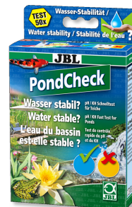
JBL PondCheck Test rápido para determinar el valor del pH y de la KH