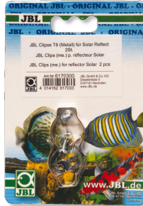
JBL Clips T5/T8 metal Soporte de metal para tubos fluorescentes