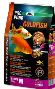
JBL PROPOND GOLDFISH M Alimen. en barras para carpas doradas medianas/grandes