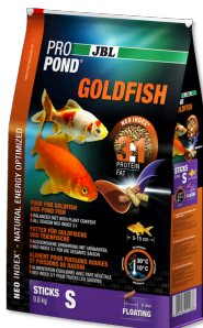
JBL PROPOND GOLDFISH S Alimento en barras para carpas doradas pequeñas