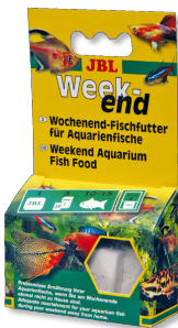
JBL Weekend Alimento compl. de fin de semana para todos los peces