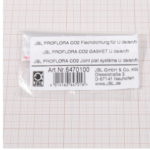
JBL PF CO2, U için düz conta