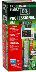
JBL PROFLORA CO2 PROFESSIONAL SET U Komple CO2 bitki gübr. cihaz seti + CO2-pH kuman. cih.