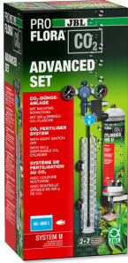
JBL PROFLORA CO2 ADVANCED SET U Komple CO2 bitki gübr. cihaz seti + gece kap. düzeneği