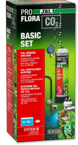
JBL PROFLORA CO2 BASIC SET U Akv. bitkileri için komple temel CO2 gübr. cihazı seti