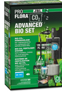
JBL PROFLORA CO2 ADVANCED BIO SET 40-110 l'lik tatlı su akv. için Bio- CO2 gübr. cihazı