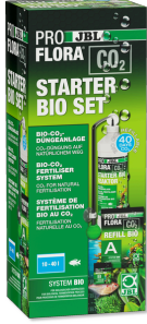
JBL PROFLORA CO2 STARTER BIO SET 10-40 l'lik tatlı su akvary. için Biyo-CO2 gübr. cihazı