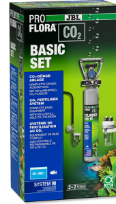
JBL PROFLORA CO2 BASIC SET M Akv. bitkileri için komple temel CO2 gübr. cihazı seti