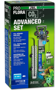
JBL PROFLORA CO2 ADVANCED SET M Komple CO2 bitki gübr. cih. seti + gece kapa. düzeneği