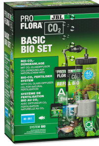
JBL PROFLORA CO2 BASIC BIO SET 40-80 l'lik tatlı su akvary. için Bio-CO2 gübr. cihazı