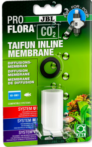
JBL PROFLORA CO2 TAIFUN INLINE MEMBRANE

CO2 TAIFUN INLINE difüzörü için yedek membran