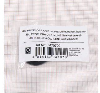
JBL PF CO2 INLINE conta seti