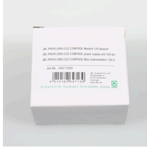
JBL PF CO2 CONTROL güç adaptörü 12V