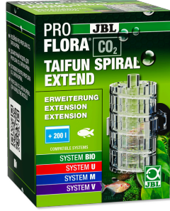
JBL PROFLORA CO2 TAIFUN SPIRAL EXTEND JBL PROFLORA CO2 TAIFUN SPIRAL 5 / 10 için genişletme