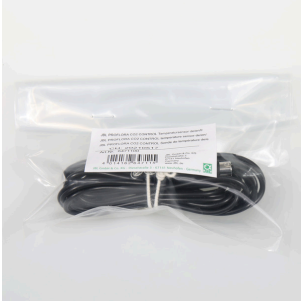
JBL PF CO2 CONTROL sıcaklık sensörü