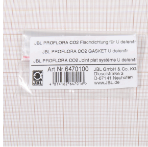
JBL PF CO2, U için düz conta