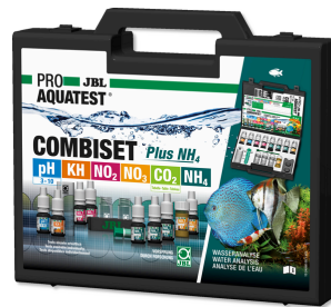
JBL PROAQUATEST COMBISET Plus NH4 NH4-Test + en önemli su testlerini içeren test çantası