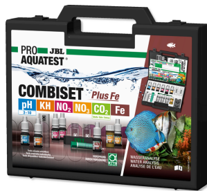
JBL PROAQUATEST COMBISET Plus Fe En önemli testleri + demir testini içeren test çantası