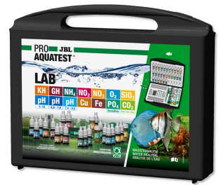
JBL PROAQUATEST LAB Tatlı su analizi için 13 su testli test çantası