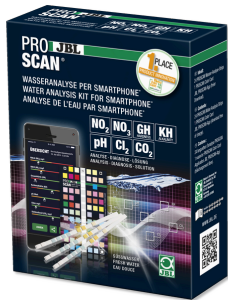
JBL PROSCAN Akıllı telefonla değerlendirilen su testi