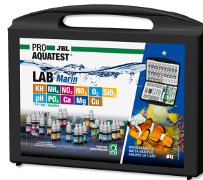
JBL PROAQUATEST LAB Marin Tuzlu su analizleri için profesyonel test seti