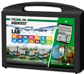
JBL PROAQUATEST LAB Tatlı su analizi için 13 su testli test çantası