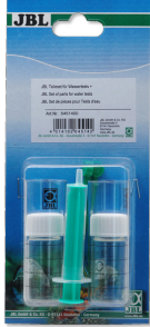
Su testleri için JBL parça seti