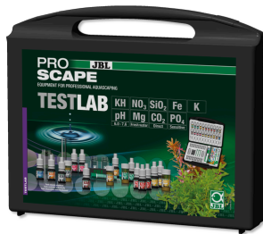
JBL PROAQUATEST LAB PROSCAPE Bitki akvaryumlarında su analizi için test çantası