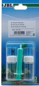
Su testleri için JBL parça seti