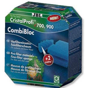
JBL CombiBloc CristalProfi e CristalProfi e için ön filtre elemanları ve sünger