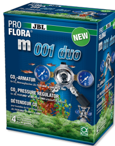
JBL PROFLORA m001 duo 2 adet CO2 difüzörü için basınç düşürme armatürü