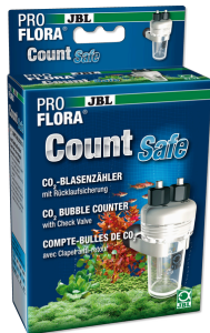
JBL PROFLORA CO2 Count Safe Çek valfli kabarcık sayacı