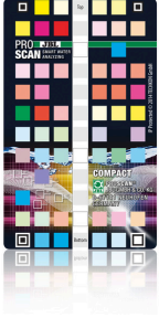
JBL PROSCAN ColorCard