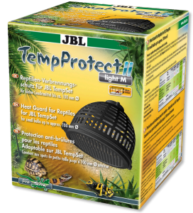
JBL TempProtect II light JBL TempSet için sürüngenl. yanıkl. karşı koruy. aksam