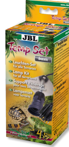
JBL TempSet basic Teraryumlarda kull. spot lambalar için montaj seti