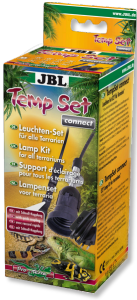
JBL TempSet connect Soket bağlantılı montaj seti