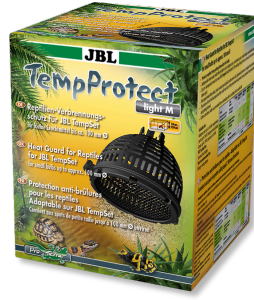
JBL TempProtect light JBL TempSet'ler için sürüng. yanıkl. karşı kor. aksam