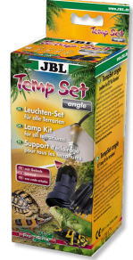
JBL TempSet dirsek Teraryumlarda kull. spot lambalar için montaj seti