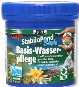
JBL StabiloPond basis Tüm bahçe havuzları için temel bakım ürünü