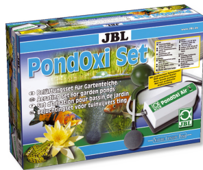
JBL PondOxi-Set Bah.hav. için hv. pomp. ile birlikte havalandırma seti