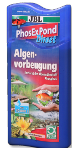
JBL PhosEx Pond Direct Havuz için fosfat giderici