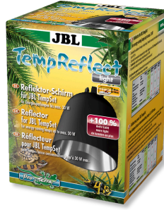
JBL TempReflect light Enerji etkin lambalar için reflektör kalkanı