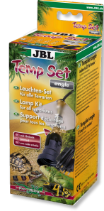
JBL TempSet dirsek Teraryumlarda kull. spot lambalar için montaj seti