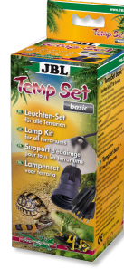
JBL TempSet basic Teraryumlarda kull. spot lambalar için montaj seti