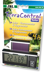
JBL TerraControl Solar Tüm teraryumlar için Solar termometre ve higrometre