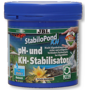
JBL StabiloPond KH