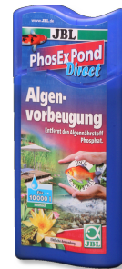
JBL PhosEx Pond Direct

pH ve KS değerini belirlemek için hızlı test