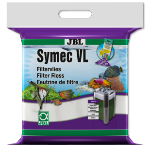
JBL Symec VL Her türlü su bulanıkl. karşı akv. filt.-pamuğu keçesi