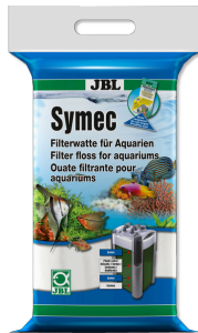
JBL Symec Tüm su bulanıklıklarına karşı filtre pamuğu