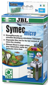
JBL Symec micro Akv. filt. için su bulanıklıklarına karşı mikro keçe