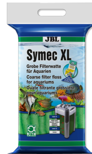
JBL Symec XL Filtre yünü Her türlü su bulanıklığına karşı kaba akv. filt. pam.