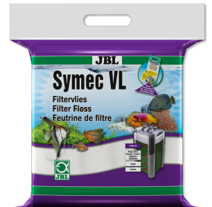
JBL Symec VL Her türlü su bulanıkl. karşı akv. filt.-pamuğu keçesi