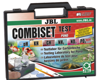
JBL Test Combi Set Pond

Bahçe havuzları için en önemli su testleri