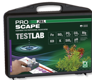
JBL Testlab ProScope Bitki akvaryumlarında su analizi için test çantası