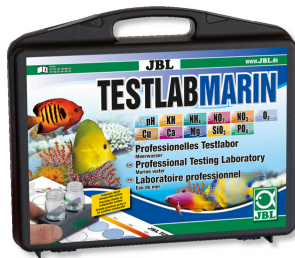
JBL Testlab Marin Deniz suyu analizi için profesyonel test çantası