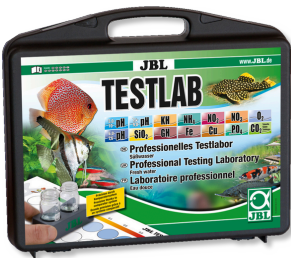
JBL Testlab Testlab, t. su anal. için 13 ad. test içeren test çantası