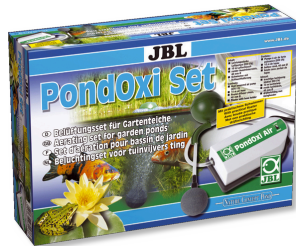
JBL PondOxi-Set Bah.hav. için hv. pomp. ile birlikte havalandırma seti