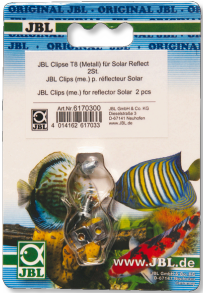
JBL T5/T8 metal klipsleri

Floresan tüpler için yüksek etkili reflektör plakası