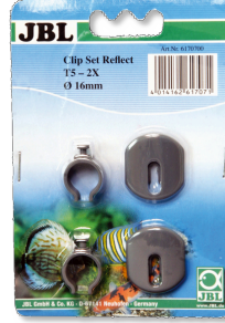
JBL SOLAR REFLECT klips seti Floresan tüpler için askı seti