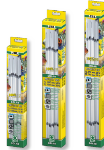
JBL SOLAR Reflect T5/ T8 - 895-1500 mm

Solar floresan tüpler için reflektör plaka