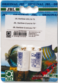
JBL Start Solar T8 floresan tüpler için starter