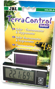
JBL TerraControl Solar Tüm terraryumlar için Solar termometre ve higrometre