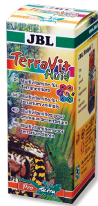
JBL TerraVit fluid Teraryum hayvanları için vitaminler ve eser elementler