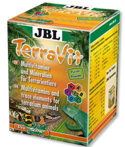
JBL TerraVit Powder Teraryum hayvanları için vitaminler ve eser elementler