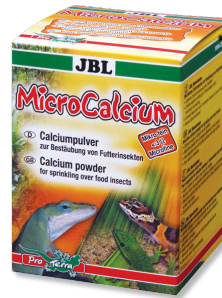
JBL MicroCalcium Tüm sürüngenler için mineralli tamamlayıcı yem