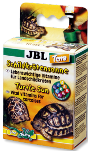
JBL Tortoise Sun Terra Kara kaplumbağaları için vitamin