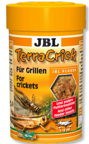
JBL TerraCrick Yemlik böcekler için tam yem