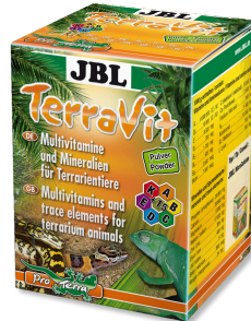
JBL TerraVit Powder Teraryum hayvanları için vitaminler ve eser elementler