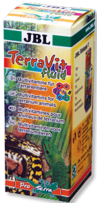
JBL TerraVit fluid Teraryum hayvanları için vitaminler ve eser elementler