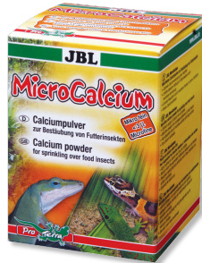
JBL MicroCalcium Tüm sürüngenler için minerali tamamlayıcı yem