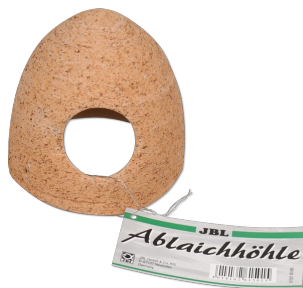
JBL Seramik Yumurtlama Mağarası

Akvaryumlar ve teraryumlar için Hindistan cevizi kovuk