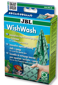
JBL WishWash Temizleme bezi ve sünger