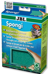
JBL Spongi Akvaryumlar ve teraryumlar için temizleme süngeri