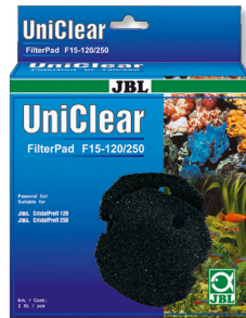
JBL FilterPad F15 CristalProfi akvaryum filtresi için kaba sünger