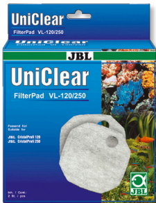
JBL FilterPad VL CristalProfi akv. filtresi için dokusuz kumaş pamuk