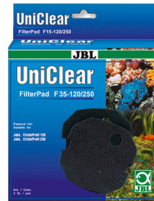
JBL FilterPad F35 CristalProfi akvaryum filtresi için ince sünger