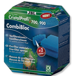
JBL CombiBloc CristalProfi e CristalProfi e için ön filtre elemanları ve sünger