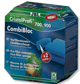
JBL CombiBloc CristalProfi e CristalProfi e için ön filtre elemanları ve sünger