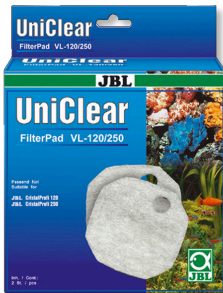
JBL FilterPad VL CristalProfi akv. filtresi için dokusuz kumaş pamuk