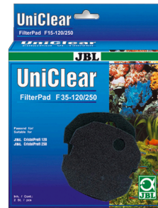
JBL FilterPad F35 CristalProfi akvaryum filtresi için ince sünger