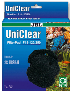
JBL FilterPad F15 CristalProfi akvaryum filtresi için kaba sünger