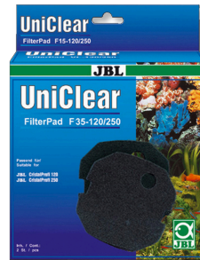
JBL FilterPad F35 CristalProfi akvaryum filtresi için ince sünger