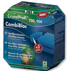
JBL CombiBloc CristalProfi e CristalProfi e için ön filtre elemanları ve sünger