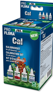
JBL PROFLORA Cal Kalibrasyon için komple set