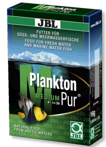
JBL PlanktonPur MEDIUM Büyük akvaryum balıkları için atıştırma