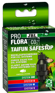
JBL PROFLORA CO2 TAIFUN SAFESTOP Waterterugloopventiel voor CO2 installaties