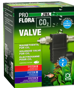
JBL PROFLORA CO2 VALVE CO2 magneetventiel voor een gecontroleerde CO2 toevoer