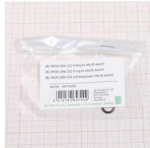
JBL PF CO2 o-ring voor VENTIEL