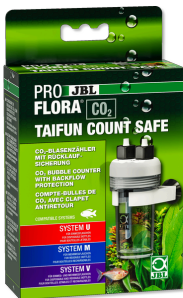
JBL PROFLORA CO2 TAIFUN COUNT SAFE CO2-bellenteller met ingebouwd terugloopventiel