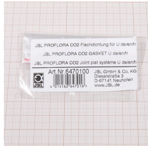
JBL PF CO2 platte dichting voor U