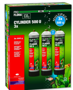
JBL PROFLORA CO2 CYLINDER 500 U 3x 500 g CO2 wegwerp fles (voordeelpak van 3)