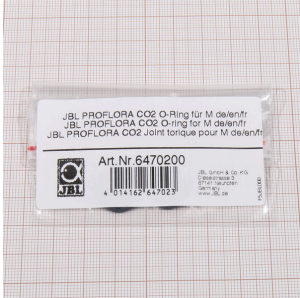
JBL PROFLORA CO2 O- ring voor M