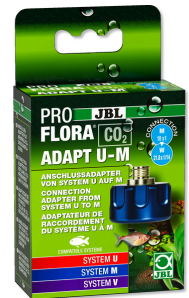
JBL PROFLORA CO2 ADAPT U - M CO2 conversieadapter: van wegwerp naar hervulbaar