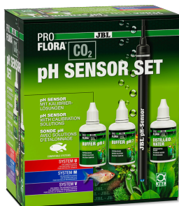
JBL PROFLORA CO2 pH SENSOR SET Électrode qualité labo pour appareils de pH