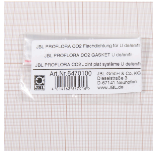
JBL PF CO2, joint plat pour U