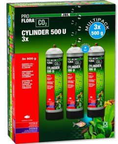
JBL PROFLORA CO2 CYLINDER 500 U 3x 500 g CO2-Einweg-Vorratsflasche (3er Vorteils-Pack)