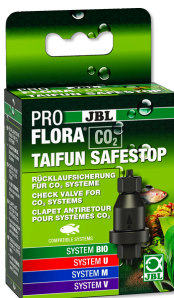
JBL PROFLORA CO2 TAIFUN SAFESTOP Wasserrücklaufsicherung für CO2-Anlagen